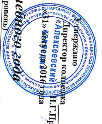
График учебного процесса на I полугодие 2016-2017 учебного года